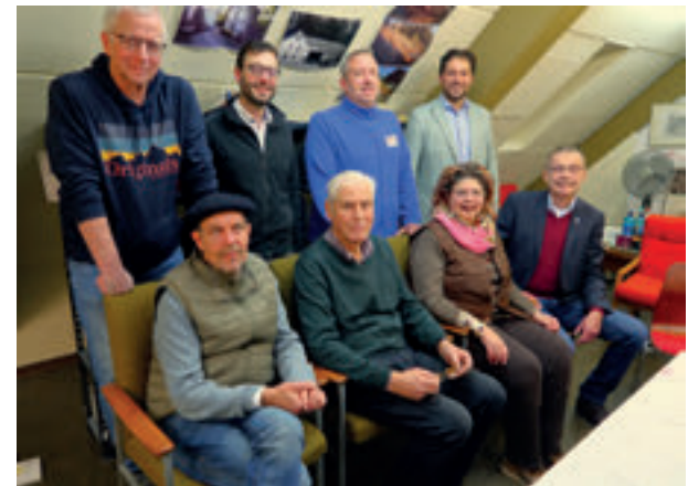
Der Weilburger Geschichtsverein und sein historisches Archiv