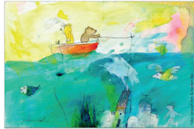
Janosch kommt ins Rosenhang Museum nach Weilburg