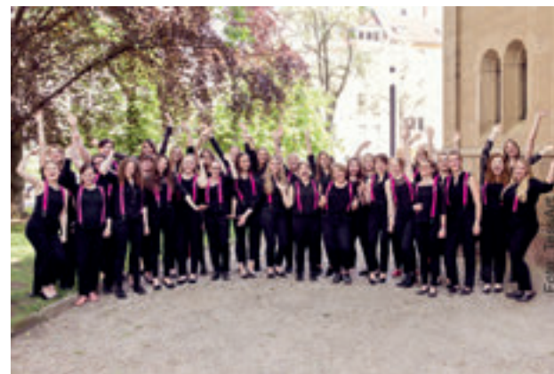
Fünf Jahre Gartenkonzerte in Gaudernbach