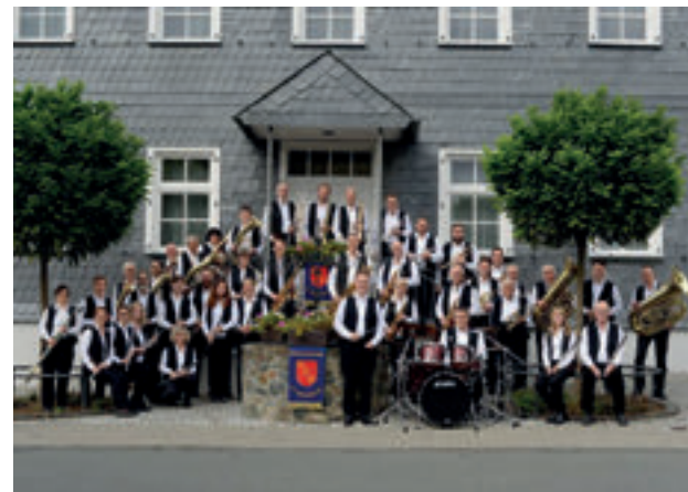
Abwechslungsreiches Programm an Brunnenkonzerten in Weilburg