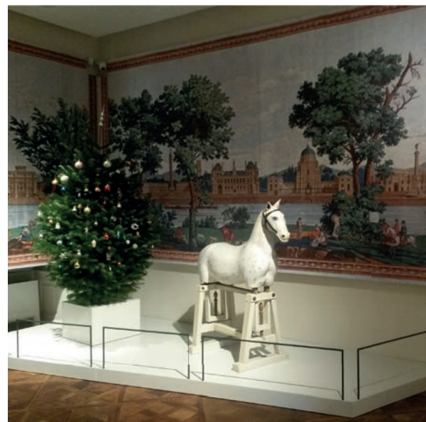
Eine Traumhochzeit, Seite 12