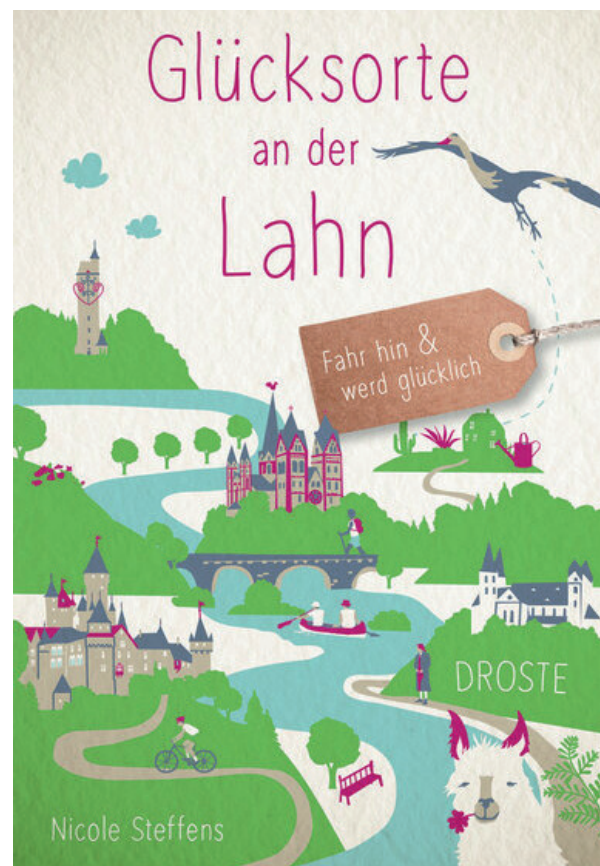
Glücksorte and der Lahn, Seite 9