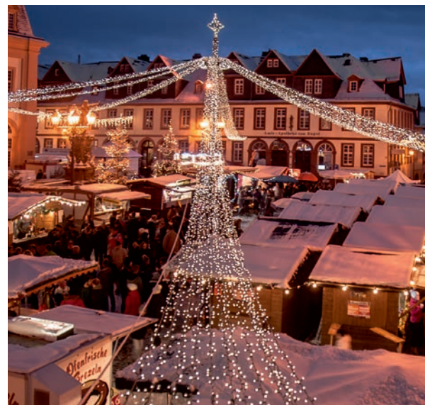
Traditioneller Weihnachtsmarkt, Seite 15