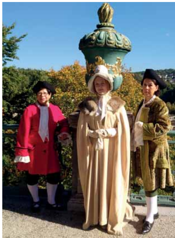
Stadtführungsprogramm 2022, Seite 12