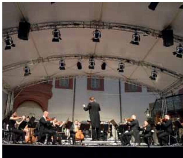
Musik in Weilburg, Seite 7