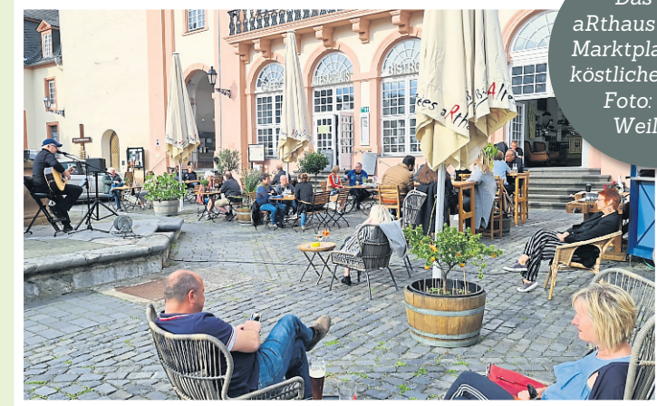
Das Alte aRthaus auf dem Marktplatz bietet köstliche Speisen.

Köstliche Eisspezialitäten und italienischer Kaffee in charmantem Ambiente in der Stadtmitte. Im Sommer mit Außenbestuhlung. Neugasse 3, 35781 Weilburg, Telefon 06471-2594.