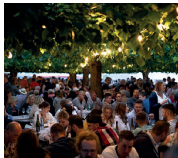
Veranstaltungshinweise in Weilburg von März bis Mai 2026, Seite 16