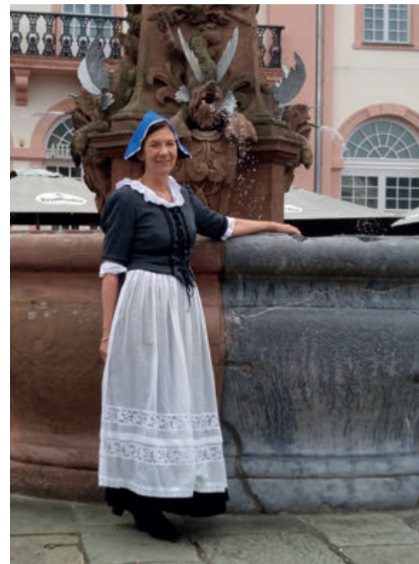
Öffentliche Stadtführungen im ersten Halbjahr 2026, Seite 11