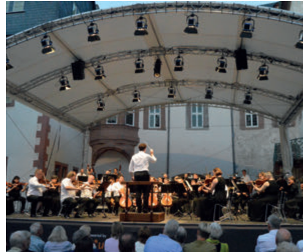
Zwei Monate wunderbare Musik bei den 54. Weilburger Schlosskonzerten, Seite 8