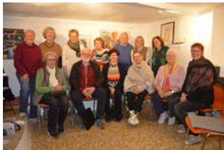
Mitglieder des neu gegründeten Künstlerforum 24 Weilburg:

Ab 13. Dezember bis Jahresende: Treffpunkt Künstlerforum 24 Weilburg am Marktplatz: Ausstellung Künstlerforum 24 Weilburg