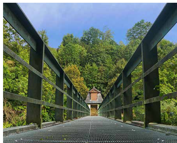
40 Jahre Fotoclub Weilburg -Limburg