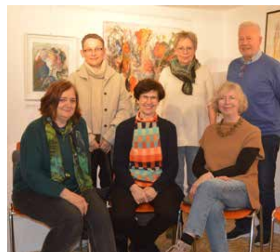
Neuer Kunstverein in Weilburg