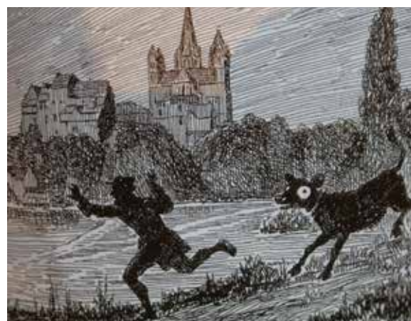
Von Muhkalb und Unkenkönig