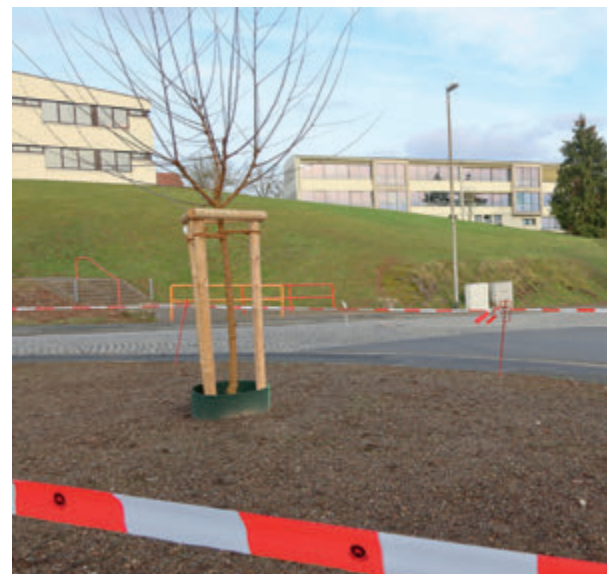
Weilburg blüht auf: 44 neue Bäume, 7000 Blumenzwiebeln lassen städtische Grünflächen erblühen, Seite 12