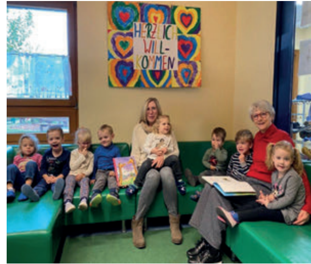
Wie wäre es mit einem Engagement im Ehrenamt?, Seite 6