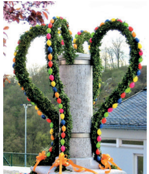
Gedanken zu Brauchtum und Tradition des Osterfestes, Seite 9