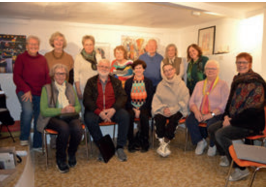
Mitglieder des neu gegründeten Künstlerforum 24 Weilburg:

Weilburger Wochenmarkt - immer mittwochs von 8 bis 14 Uhr auf dem Marktplatz in Weilburg. Ende der Winterpause - Ausstellung Künstlerforum 24 Weilburg