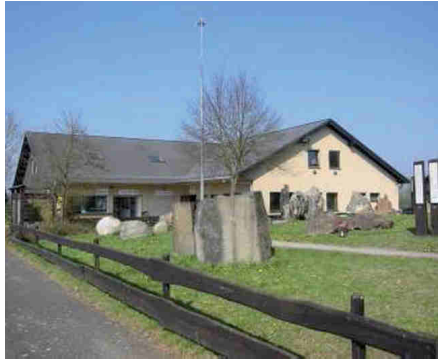
Höhlengebäude mit Freilicht– Steinemuseum