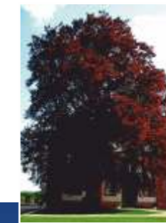
Rotbuche im Schlossgarten

Geführte Wandertouren rund um Weilburg Touren auf Anfrage z. B. Lahnwanderung 120 Minuten oder länger Gruppenpreis ab 70,00 €