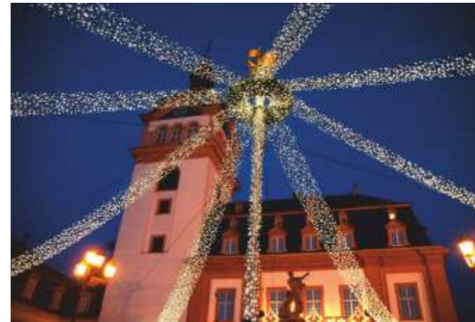
Lichtzelt auf dem Marktplatz

Nur als öffentliche Stadtführungen buchbar, Termine und Themen auf unserer Homepage.