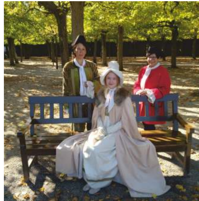
Darsteller der Schauspielführung

Die Schauspielführung ist auch als Indoor-Henriettenschau im Hotel möglich. Preis auf Anfrage.