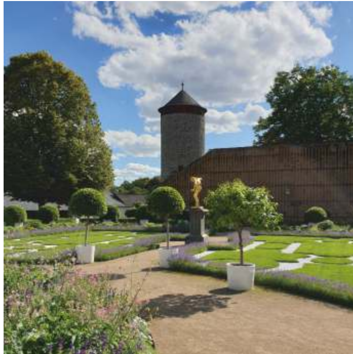
Schlossgarten und Stadtturm

Informativ, spannend und abwechslungsreich – die barocke Residenzstadt Weilburg lässt sich am besten bei einer der facettenreichen Stadtführungen erkunden. Sie erleben mit erfahrenen Gästeführern einen Streifzug durch die historische Altstadt von Weilburg und durch die Geschichte der Stadt, in der sich schon immer Könige, Grafen und Prinzessinnen zu Hause gefühlt haben. Die Weilburger Altstadt rund um das Schloss zählt heute zu den Baudenkmälern von internationalem Rang. Neben der klassischen Altstadtführung werden zahlreiche Themen-, Kostüm- und Schauspielführungen mit verschiedenen Schwerpunkten sowie auch Wanderführungen angeboten.