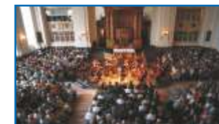
Alte Musik im Weilburger Schloss

Neben bekanntem klassischem Repertoire bietet die Reihe „Alte Musik im Weilburger Schloss“ erlesene Konzerte mit Werken aus den verschiedenen Epochen von der Zeit der Gregorianik bis hin zur Spätromantik, dargebracht in historischer Aufführungspraxis auf Instrumenten der jeweiligen Epoche oder deren Nachbauten.