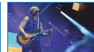
POP am Fluss

Ein fester Bestandteil des musikalischen Angebots sind auch die Weilburger Brunnenkonzerte, die im Sommer am Neptunbrunnen auf dem historischen Marktplatz stattfinden. Hier wird kostenfrei ein abwechslungsreiches Programm geboten.