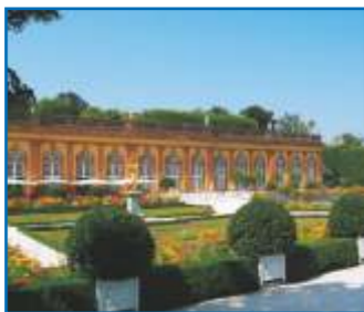
Untere Orangerie im Schlossgarten