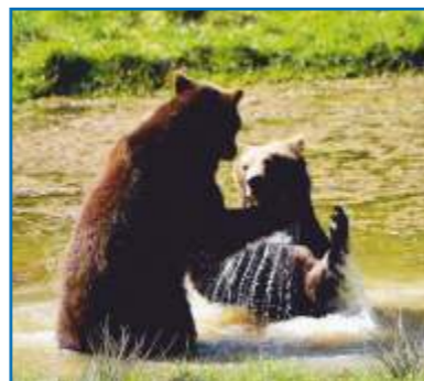
Braunbären im Tiergarten Weilburg

entdeckte Kristallhöhle, eine Hunderte von Millionen Jahre alte Unter- und Wunderwelt. Beobachten Sie im Tiergarten mächtige Elche, Luchse und Wölfe, erfreuen Sie sich am Spiel der Fischotter oder überraschen Sie die Braunbären beim Morgenbad. Kunstliebhaber können im Rosenhang Museum - ein zeitgenössisches Zentrum für Kunst und Kultur mit ständig wechselnden Ausstellungen – verweilen.