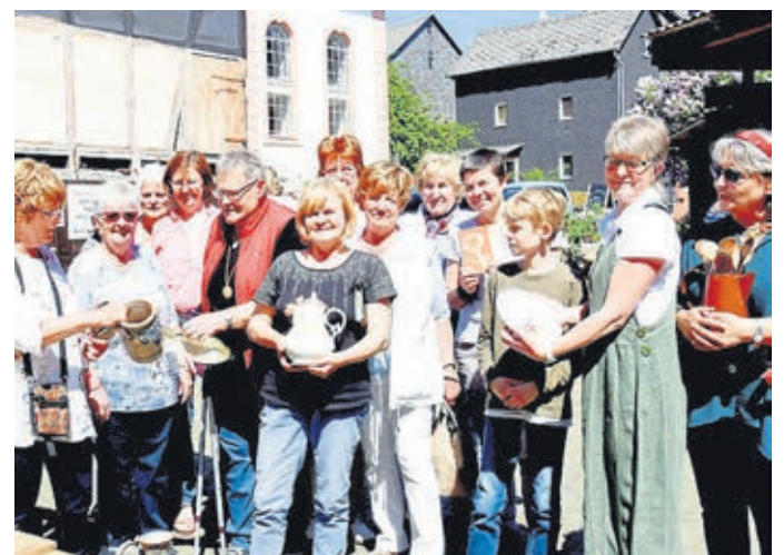
In Kubach sind Flohmärkte besonders beliebt – hier eine Erinnerung an den Flohmarkt der Landfrauen.

Ein großer Parkplatz ist an der Volkshalle in der Hauptstraße 60. Kaffee und Kuchen werden in der Hauptstraße 2 angeboten. Tagesaktuelle Infos und Pläne sind unter www.unser-kubach.de einzusehen. Kontakt ist unter Telefon 06471-41566 möglich.