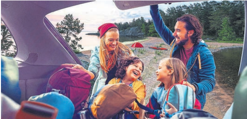
Unter www.ksk-weilburg.de/mastercardgold die Mastercard Gold der Kreissparkasse Weilburg bestellen und das Reisepaket für die ganze Familie inklusive haben.

Zu einem Girokonto bei der Kreissparkasse (KSK) Weilburg sind verschiedene Karten erhältlich, die einen unterschiedlichen Nutzen bieten. Dabei ist die rote Sparkassen-Card „Girocard“ genannt, Standard. Die Karte verfügt über einen Chip, ist NFC-fähig und hat eine vier- bis sechsstellige PIN, die man sich auch selbst ändern kann. Mit der Girocard kann man Bargeld abheben, kontaktlos (NFC) im Geschäft bezahlen, aber auch im Online-Banking eine sichere TAN erzeugen. Zur Girocard gibt es kostenfrei eine digitale Girocard dazu. Diese kann zusammen mit