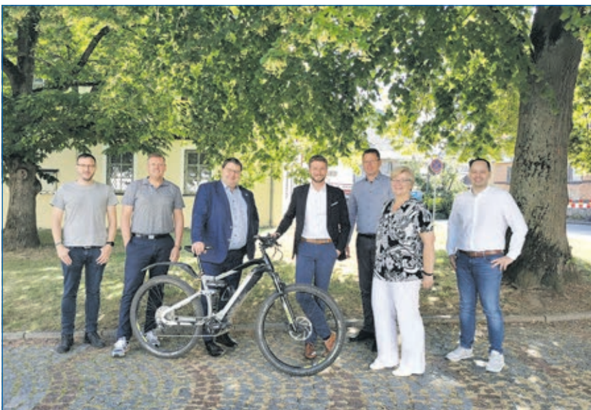
Autofreier Weital-Sonntag findet am 7. August statt