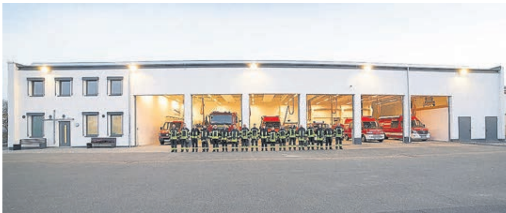
Das neue Feuerwehrgebäude mit den aktiven Feuerwehrleuten.