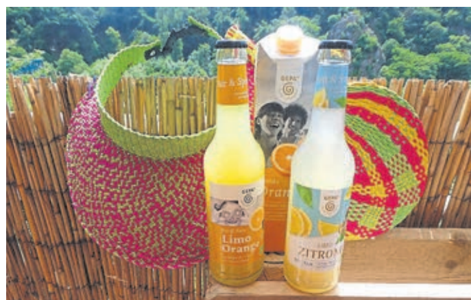
Ein Besuch in den Weltläden lohnt sich.

Kontakt: Weltladen Zwei, Mauerstraße 9, 35781 Weilburg, Telefon 06471-6291450.