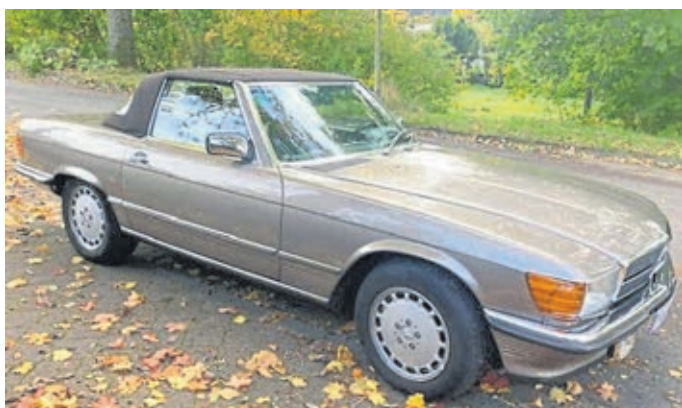
Solche Oldtimer kommen nach Weilburg.

Die Mercedes-Sportwagen-SL der Baureihe R/C 107 wurden mit verschiedenen Motorvarianten in den Jahren 1971 bis 1989 gebaut. Kein Mercedes vorher weist diese lange Produktionszeit auf. Ein Beweis dafür, dass dieses Fahrzeug zu seiner Zeit sehr modern und auch ausgereift war. Das Fahrzeug war zu seiner Zeit richtungsweisend in Qualität, Sicherheit, Straßenlage und Komfort.