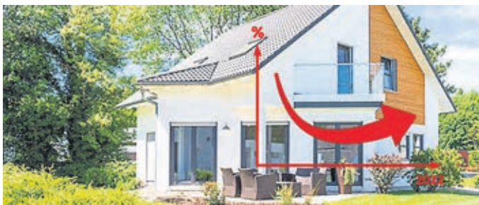
Sie haben Finanzierungspläne – jetzt oder später? Dann sollten sie jetzt handeln und sich mit LBS-Bausparen die aktuell günstigen Zinsen sichern!

(ksk). Baufinanzierungszinsen von fünf Prozent und mehr? Kennen Sie nicht? Wir erleben aktuell einen Anstieg der Zinsen. Die Zentralbanken reagieren auf die anhaltende Inflation mit der Anhebung ihrer Leitzinsen. Bereits seit Monaten kennen die Zinsen für Immobilienkredite nur eine Richtung: Sie steigen kontinuierlich und verhältnismäßig schnell an. Die Zeit der Niedrigzinsen neigt sich dem Ende. Schon ein Zinsanstieg um wenige Prozentpunkte kann Zehntausende Euro Unterschied bei einer Finanzierung ausmachen und zu hohen Belastungen führen. Niedrige Zinsen kann man sich langfristig sichern. Mit der LBS