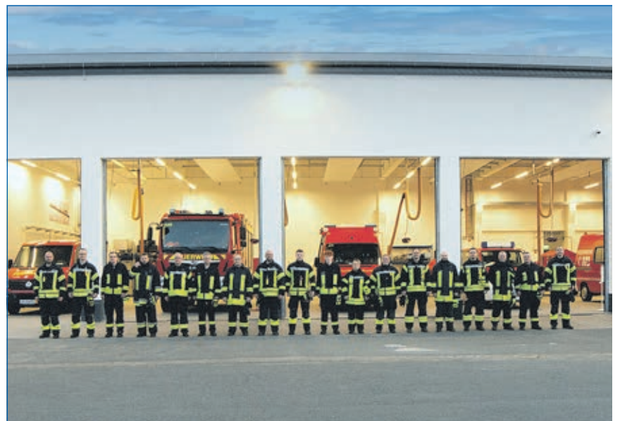
Feuerwehr Waldhausen lädt zum Tag der offenen Tore ein