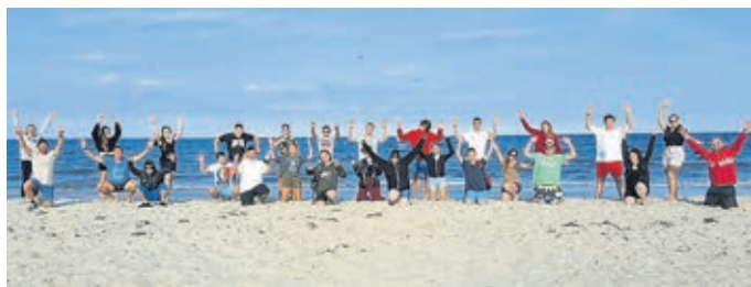
Ein schönes Erinnerungsfoto an die Jugendfreizeit im vergangenen Jahr.

Begleitet wird die Gruppe von vier Teamern. Die Kosten betragen inklusive Fahrt, Betreuung, Verpflegung und Material pro Person 210 Euro. Wer Interesse hat, kann sich noch im Internet unter www.weilburg.de anmelden. Weiterhin gibt es unabhängig davon zwei Tagesangebote, für die noch ein paar wenige Plätze gebucht werden können. Am 16. August wird eine Fahrt zum Seepark – „Hot Sport“ – Aqua-Park in Weimar an der Lahn angeboten. Am 18. August findet eine Erlebnisfahrt in das Phantasialand statt. Im Aqua-Park werden Wasserboard- oder Wasserskigrundkurse für Kinder ab zehn Jahren angeboten. Anschließend wird der größte Aqua-Fun- und Fitness-Park Deutschlands besucht. Die Teilnahme kostet 30 Euro. Die Fahrt in den beliebten Freizeitpark Phantasialand ist ebenfalls für Kinder ab zehn Jahren bestimmt. Dort warten viele spannenden Attraktionen darauf, von den Kindern ausprobiert zu werden. Die Teilnahme kostet 50 Euro. Weitere Informationen sind im Internet unter www.weilburg.de erhältlich. Hier sind auch Anmeldungen möglich.