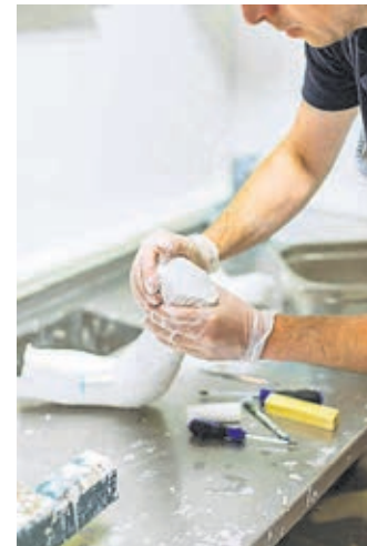
Die Bearbeitung eines Gipsabdrucks.

In einer hochmodernen orthopädietechnischen Werkstatt fertigt das Team Prothesen, Orthesen, Korsette sowie individuelle Anfertigungen. Diese werden in Handarbeit in der hauseigenen Werkstatt nach Maß hergestellt. Dabei ist computergestütztes Arbeiten bereits seit Jahren ein fester Bestandteil in der Orthopädietechnik. Die Orthopädietechnik-Meister beherrschen sowohl die traditionellen Bauweisen wie auch die neuesten orthopädietechnischen Methoden. Innovation und Tradition sind hier keine Gegensätze. High-Tech-Materialien finden in der Orthopädiestechnik