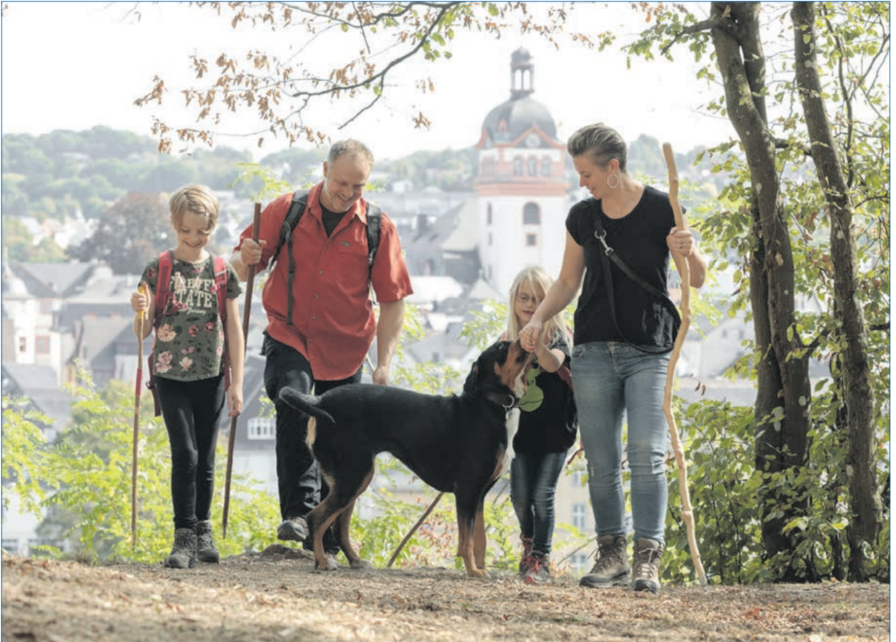
„Weilburg aktiv“ lautet eines unserer Sommerthemen