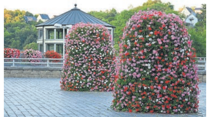
Ein schönes Motiv ist auch der König-Konrad-Platz mit seinen Geraniensäulen im Frühjahr.

Die von den Einsendern eingereichten Daten werden nur zur Abwicklung des Fotowettbewerbs gespeichert und verwendet. Die Stadt behält sich vor, für den Kalender Ausschnitte der Bilder abzdrukken. Mit der Zusendung der Bilddaten an j.voss@weilburg.de stimmen die Einsender der Verwendung der Bilder für Marketingzwecke der Stadt Weilburg zu. Eine Weitergabe der Bilddaten an Dritte außerhalb der Marketingmaßnahmen der Stadt Weilburg findet nicht statt.