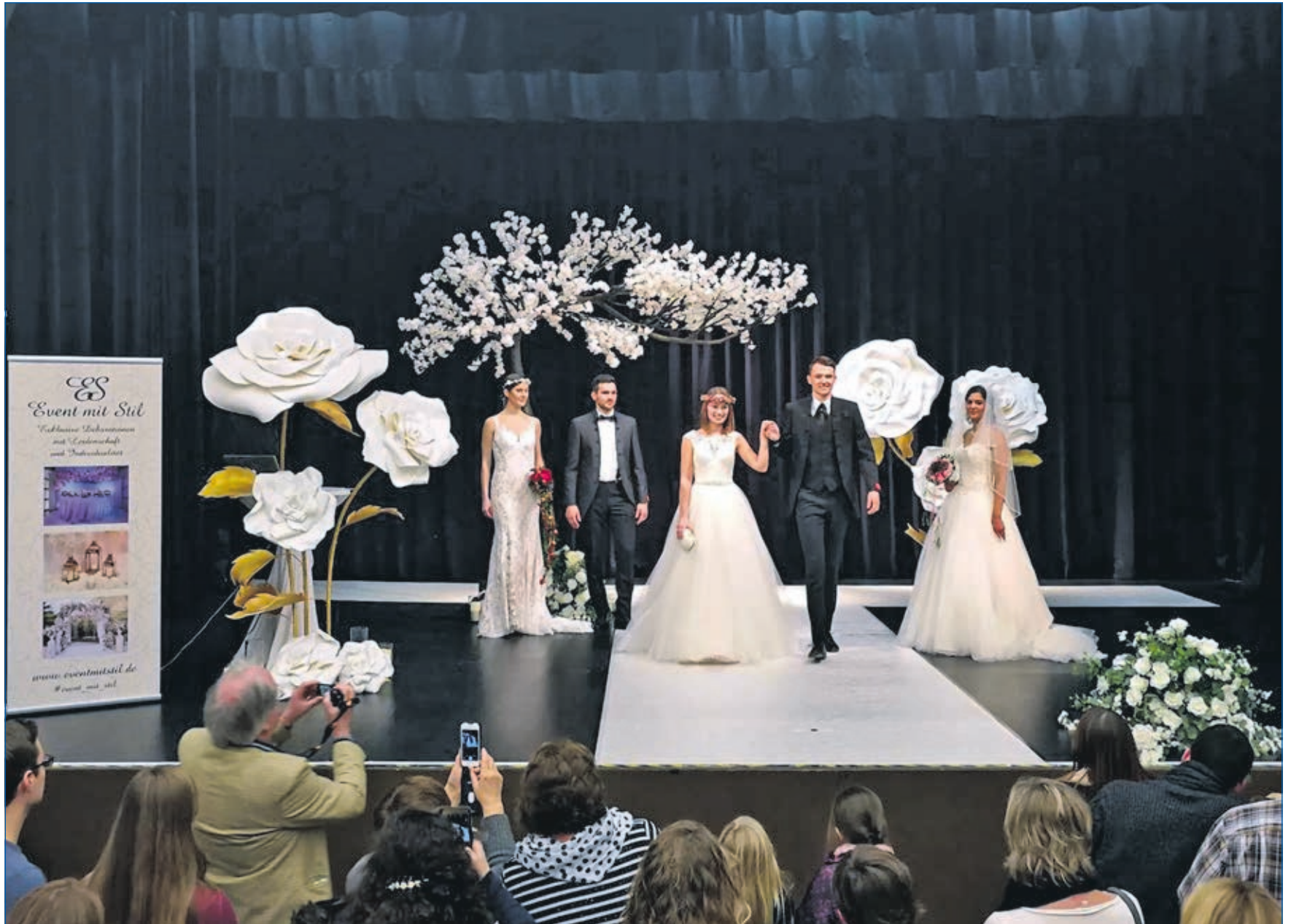
Heiraten in Weilburg.