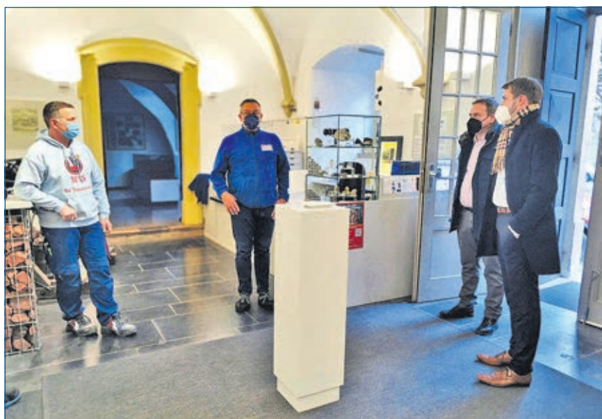
Wieder geöffnet: Das Bergbau- und Stadtmuseum Weilburg