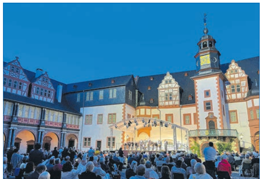
50 Jahre Schlosskonzerte: Festspiele vom 4.6. bis 6.8.2022