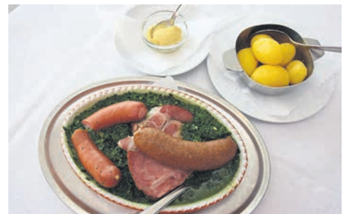
Grünkohlplatte im Gasthaus Neu.

Am Rosenmontag, 28. Februar, hält die Küche abends Labskaus mit Bismarckhering und Roter Bete bereit, am Aschermittwoch, 2. März, wird die Faschingsaison mittags und abends mit Matjes in verschiedenen Variationen und mit verschiedenen Soßen und Beilagen abgerundet. Ab dem 4. März bis 27. März kredenzen Harald Neu und sein