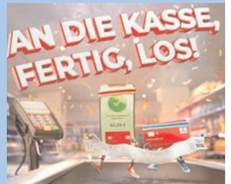
Jeder Kassenbon bringt Ihnen eine neue Gewinnchance. Wir wünschen Ihnen viel Glück.

Person kann sich ihren „Lieblingsgewinn“ aussuchen und mit Glück gewinnen. Im Gewinnfall erfolgt die Benachrichtigung bis zum 31. März 2022 per E-Mail. Daraufhin folgt der Versand der Sachpreise.