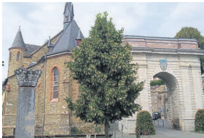
Eingang zur Altstadt: Das Landtor.