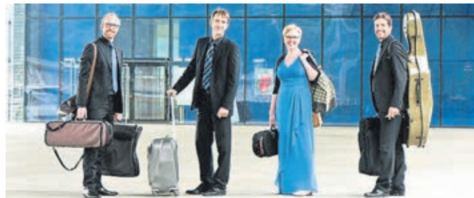
Das Ensemble Castor spielt am 20. Februar.

Zur Hofhaltung von Kardinal Ottoboni gehörten Künstler wie Arcangelo Corelli, Alessandro