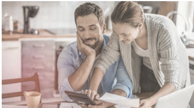
Infos auf www.ksk-weilburg.de/kreditoptimierung oder Beratungstermin vereinbaren unter 06471-3120.

(red). Kredite und Ratenzahlungen gehören zum Leben dazu. Heute ist es die Null-Prozent-Finanzierung im Elektronikmarkt, dann kommt der Kredit für das größere Familienauto. Schnell häufen sich die finanziellen Belastungen, Raten fallen zu unterschiedlichen Terminen an und der Überblick geht verloren. Das empfinden viele Menschen als erdrückend. Damit man in Zukunft ruhig und befreit schlafen kann, bündelt die Kreissparkasse Weilburg alle Kredite zu einer monatlichen Rate – bequem, einfach und meist günstiger als die bisherigen Abbuchungen. Im persönlichen Gespräch fin-