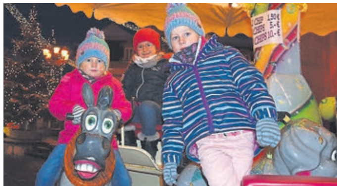
Die Kinder haben Spaß auf dem Karussell.

Ahausen lädt für 17. Dezember ab 18 Uhr zu einem Weihnachtsmarkt an der historischen Viehwäage ein.