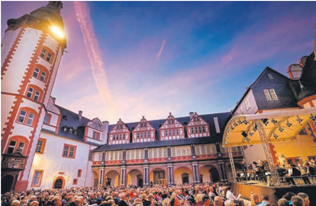
Im Renaissancehof gibt es wieder einige Veranstaltungen.