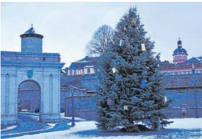
Weihnachtliche Stimmung auch in Weilburg.

Auch in der Katholischen Kirchengemeinde „Heilig Kreuz“ Weilburg gibt es Weihnachtsgottesdienste. Eine Kinderkrippenfeier steht an Heiligabend ab 16 Uhr in der Pfarrkirche „Heilig Kreuz“ an. An selber Stelle findet von 22 Uhr bis Mitternacht die Christmette statt.