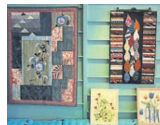
Bunte Werke.