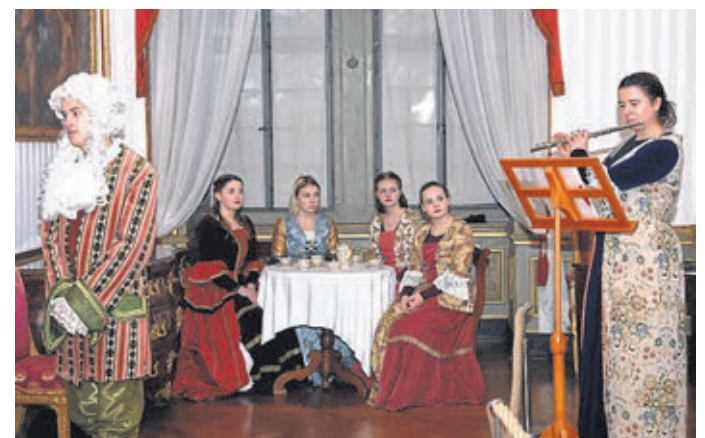
Eine Szene aus „Leben im Schloss“.

Die Eintrittspreise für die Aufführungen sind die ganz normalen Schlossführungspreise.