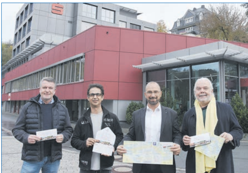
Die WWW veranstaltet wieder ein Weihnachts-Gewinnspiel.