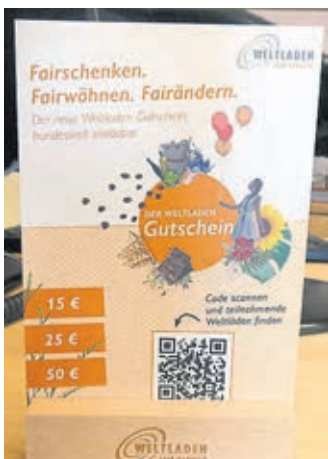
Ein Geschenkgutschein aus dem Weltladen.

(red). Mit einem Weltladen-Gutschein werden nicht nur liebe Menschen „fairwöhnt“, sondern es wird auch noch ein Beitrag für