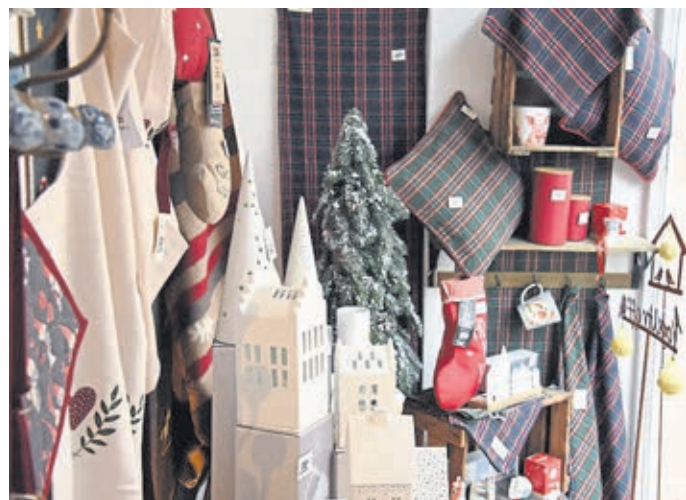
Blick von der Seite in ein Schaufenster.

bittet darum, wenn möglich, Familienpizzen einen Tag vorher zu bestellen. Aktualisiert wurde das Angebot „Schüler-Spezial“: Bei Sammelbestellungen ab drei Pizzen gibt es die Pizza Margherita für fünf Euro statt für sieben Euro. Die Lieferkosten wurden aufgrund der gestiegenen Energiekosten etwas angepasst. Wer eine Advents- oder Weihnachtsfeier plant: Es sind noch Termine zu vergeben. Im Wintergarten, in den die beeindruckende mediterrane Pflanzenwelt vor Kurzem von den Außenterrassen umgesiedelt wurde, finden 25 bis 30 Personen Platz. Auch für Versammlungen und Vereinstreffen bietet sich dieser schöne Raum an. Wer das Bio-Öl aus den Oliven, die die Familie Orbita in Sizilien auf ihren Feldern erntet und zu Öl verarbeitet, schätzt, kann jetzt wieder welches bestellen. Kontakt: Pizzeria Michelangelo, Hainallee 6, 35781 Weilburg, Telefon: 06471-7320, Internet: www.pizzeria-michelangelo-weilburg.de