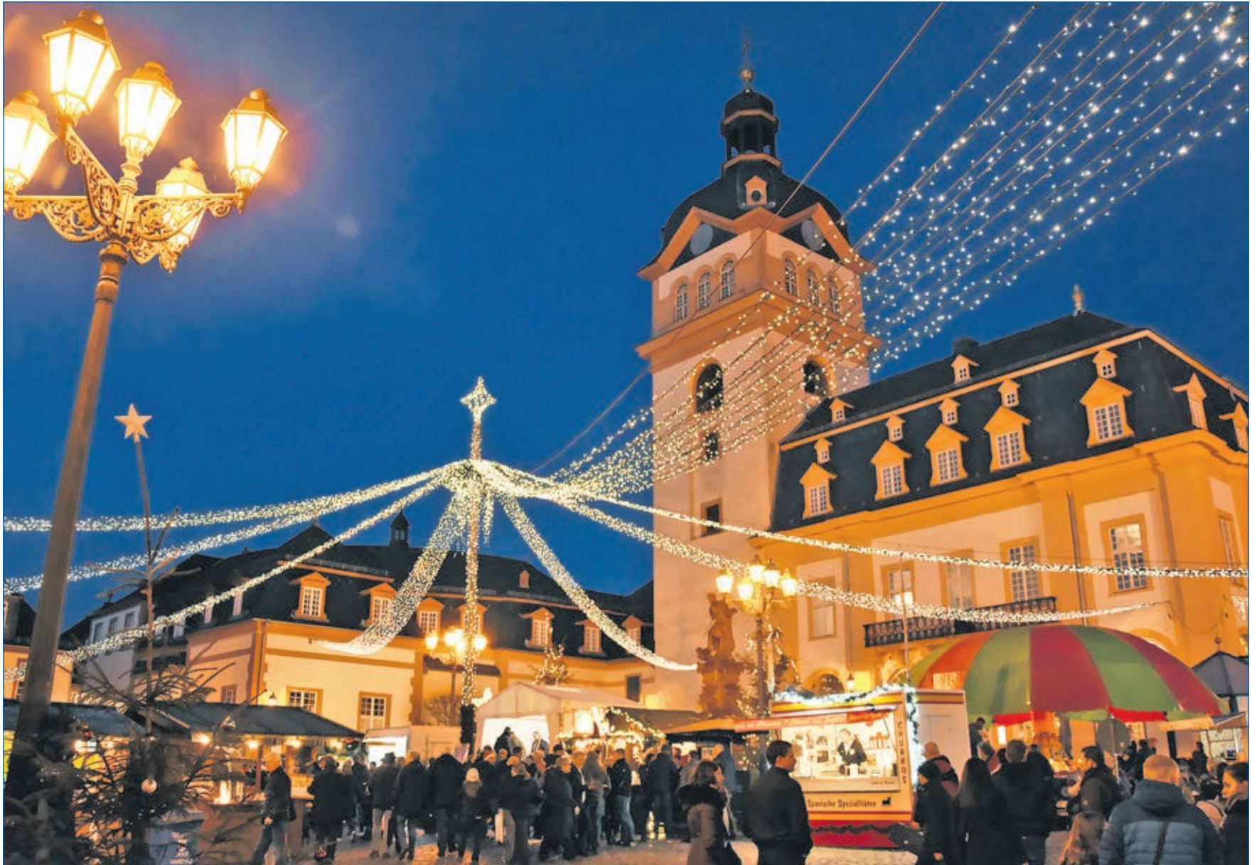
Der Weilburger Weihnachtsmarkt lädt am dritten und vierten Adventswochenende unter das Lichterzelt auf dem Marktplatz ein.