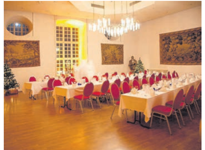
Blick in einen weihnachtlich geschmückten Saal im Schlosshotel.

Nachdem vor allem die Weihnachtsfeiern in den letzten zwei Jahren zum Großteil ausfallen mussten, ist es wieder an der Zeit, seinen Mitarbeitern zum Jahresende für ihren Einsatz zu danken und in entspanntem Ambiente mit den Kollegen zu feiern. Je nach Größe des Teams oder des Kollegiums stehen Räume zur Wahl: ob ein genussvoller Abend in kleiner Runde im Restaurant oder eine ausgelassene Feier, für die die gesamte Bankettebene reserviert wird.