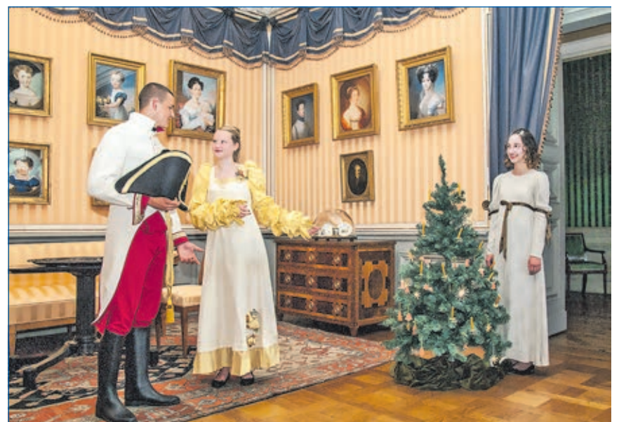
Am dritten Adventswochenende präsentieren Schülerinnen und Schüler „Leben im Schloss“.