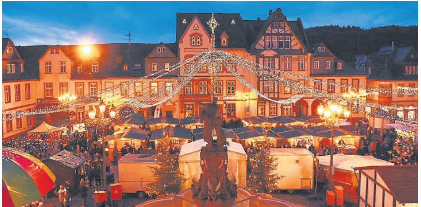
Besonders in den Abendstunden erstrahlt der Weihnachtsmarkt in einem einmalig schönen Licht.

Für die jüngeren Besucher dreht ein Karussell seine Runden. Samstags und sonntags gibt es für die Kinder von 14 bis 17 Uhr eine betreute Basteilecke sowie Kinderschminken. Zusätzlich kommt am Samstag, 10. Dezember, um 14.30 Uhr für alle Kin-