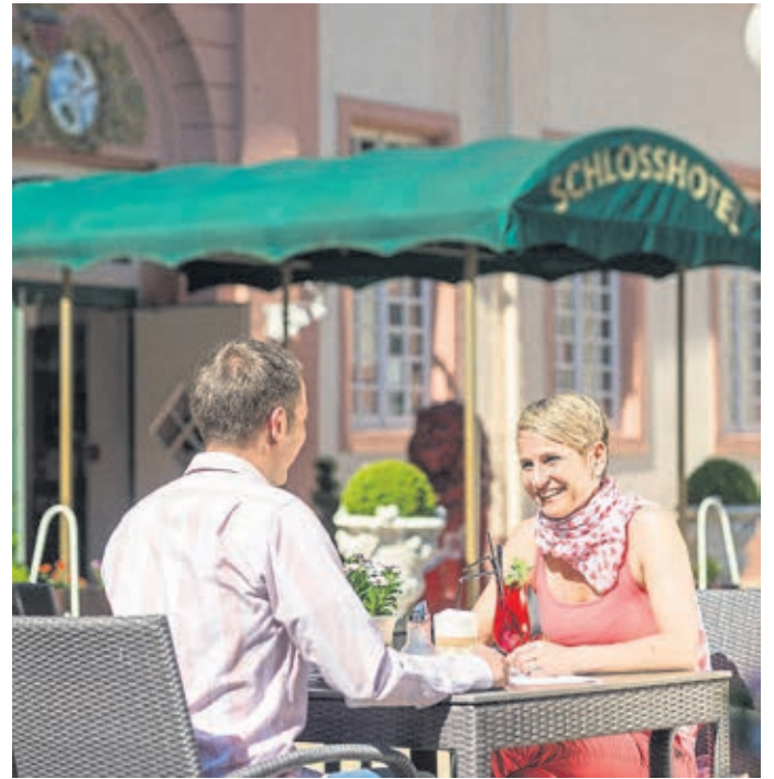
Die Corona-Zwangspause ist vorbei.

Unter Telefon 06471-944210 und -11 sowie online unter www.weilburger-schlosskonzerte.de gibt es weitere Informationen.