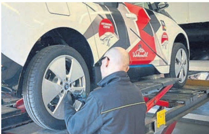
Für den guten Zweck werden Reifen gewechselt.

Kontakt: Fix Auto Weilburg, Frankfurter Straße 71, 35781 Weilburg, Internet automobilcenter-weilburg.de