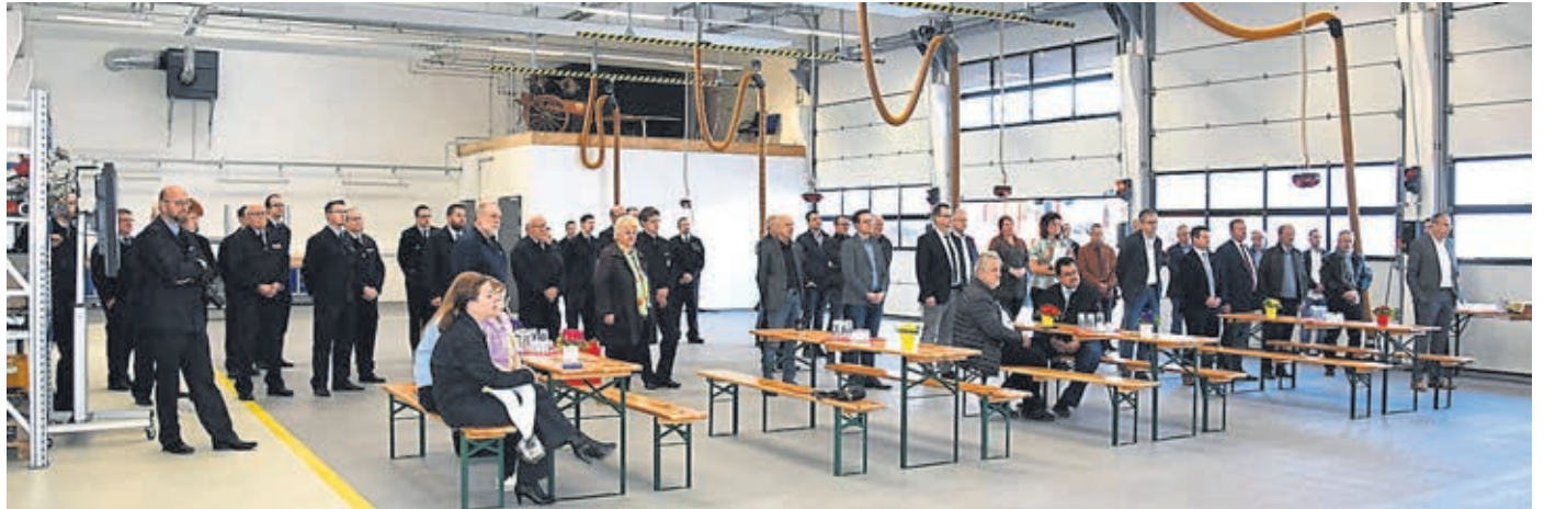
Ein Blick in die neue Fahrzeughalle mit den Gästen.