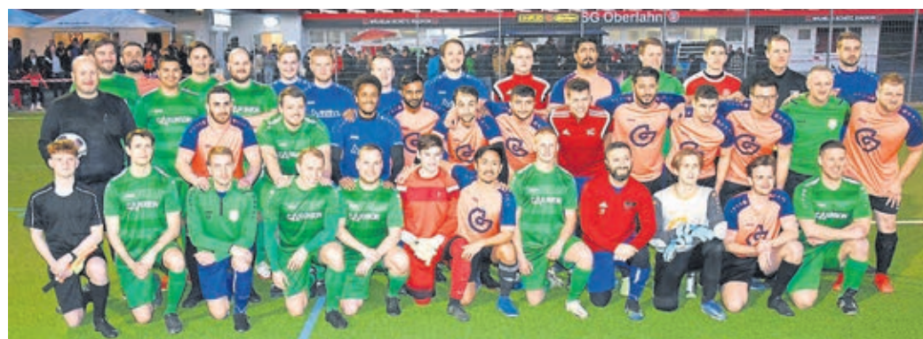
Die Fußballer und das Schiedsrichtergespann.