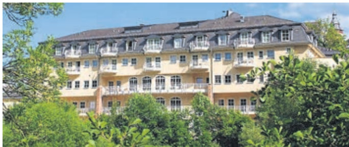
Das Hotel „Lahnschleife“ in der Hainallee 2.

Kontakt: Hotel „Lahnschleife“, Hainallee 2, 35781 Weilburg, Telefon 06471-49210, Internet www.hotel-lahnschleife.de