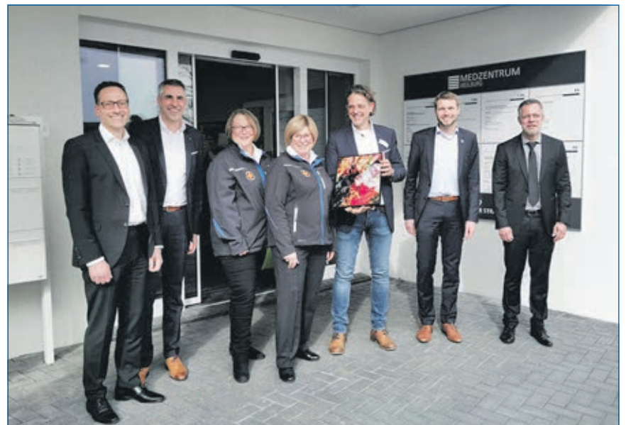
Feierliche Eröffnung des neuen Medzentrum Weilburg