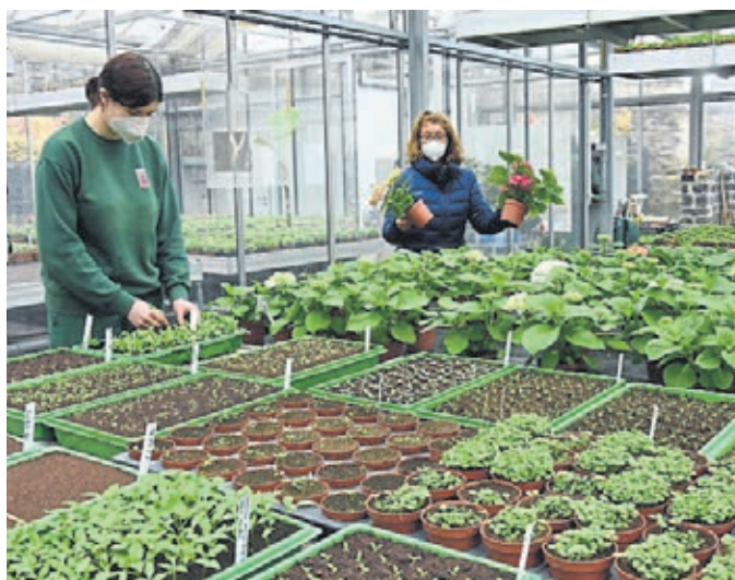
Die Schlossgärtnerei öffnet am Sonntag ihre Pforten.