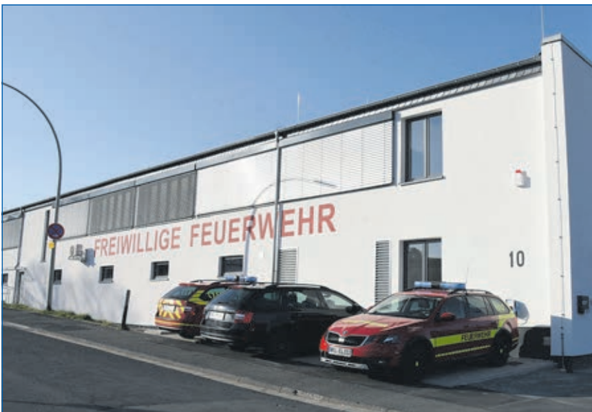
Einweihung des Feuerwehrhauses in Waldhausen