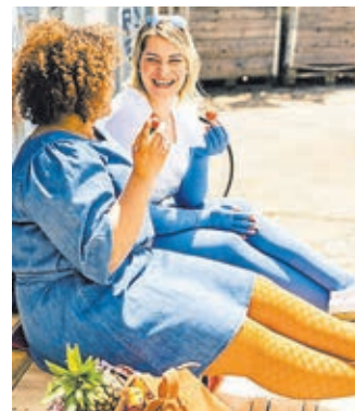
Strümpfe gibt es in vielen Varianten.

(red). Schwere, müde Beine und Krampfader können Hinweise auf ein Venenleiden sein. Ursachen für ein Lymphödem oder Lipödem können Schwellungen, Spannungsgedühle, druckempfindliche Beine und Arme sein. Mit medizinischen Kompressionsstrümpfen fühlen sich die Beine leichter und entspannter an. Bei Orthopädietechnik Kern gibt es jetzt Strümpfe in vielen neuen Mustern und Farben, darunter auch in Avocado- und Mangogelb. Rundgestrickte Ausführ-