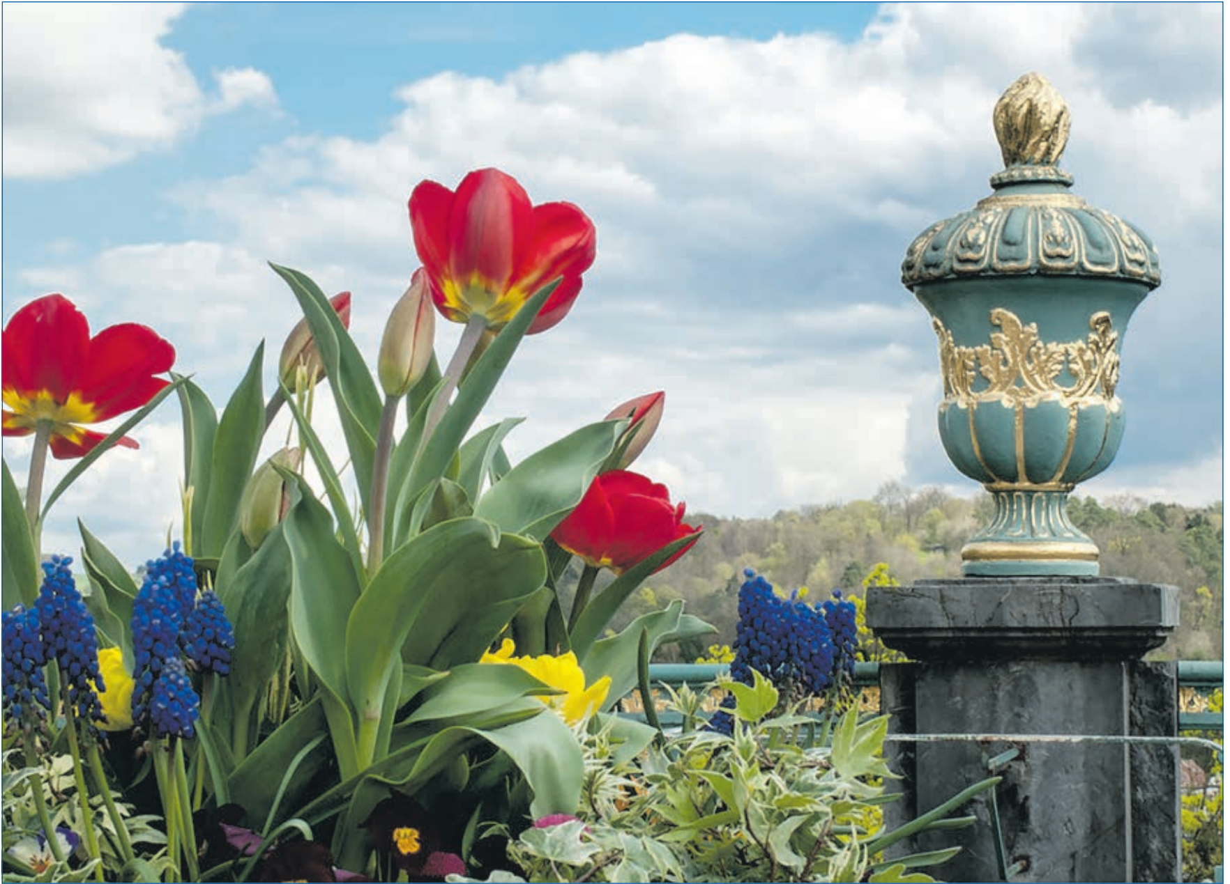
Weilburger Frühlingsmarkt mit verkaufsoffenem Sonntag und Autoschau