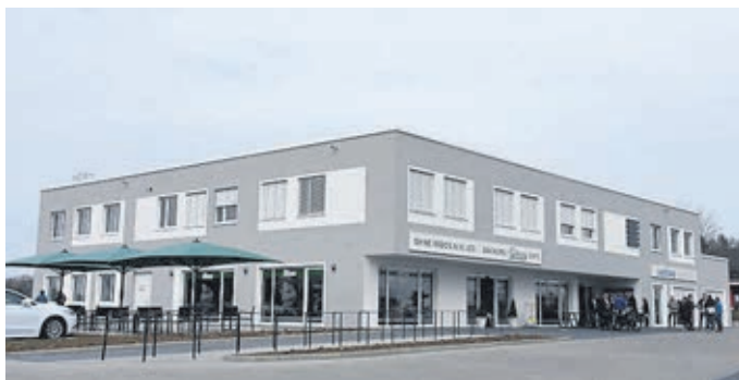
Ein Blick auf das neue Medzentrum in der Frankfurter Straße 69.