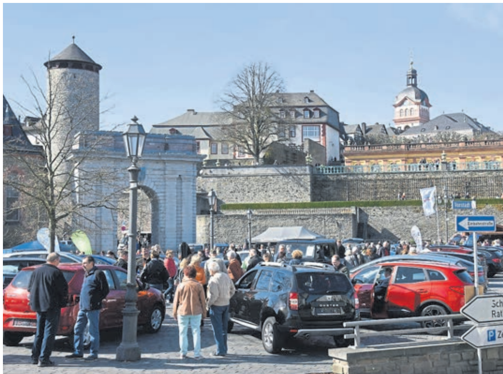
Die Autoschau auf dem König-Konrad-Platz.