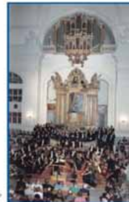
Zauber der Musik erleben Sie in der Schlosskirche, dem größten protestantischen Sakralbau Hessens.

Kartenvorverkauf: Tourist-Information Weilburg, Telefonnummer (0 64 71) 3 14 67.