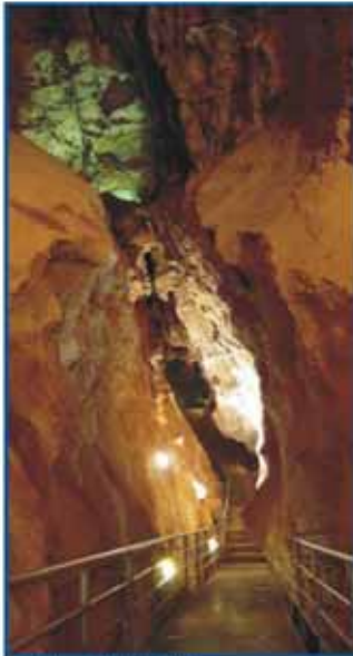
Die Kubacher Kristallhöhle.

Nicht nur diese, sondern auch viele andere sehenswerte Urlaubsziele hat Weilburg und seine Umgebung zu bieten. Für Naturfreunde den ehemaligen Jagdpark der Grafen zu Nassau-Weilburg. Den einzigen Schifftunnel in Deutschland sowie das Bergbau- und Stadtmuseum mit einer Schaustollenanlage. Für jeden ist etwas dabei.