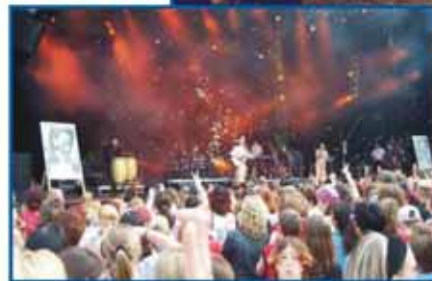
Jährlich stattfindende Konzerte, nicht nur für die Jugend.

Informationen zu den Schlosskonzerten erhalten Sie unter der Telefonnummer: (0 64 71) 94 42 11 oder www.weilburger-schlosskonzerte.de