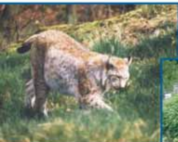
Artenvielfalt im Weilburger Tiergarten.

Informationen zum Bergbau- und Stadtmuseum unter Tel.: (0 64 71) 37 94 47.