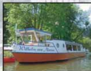
Schiffstouristik an der Lahn Tel.: (0 64 71) 3 14 67

„Floßfahrt“ auf der Lahn (ca. 4 Std.) ab/bis Diez, 100 Plätze ab/bis Nassau, 90 Plätze bei Korn, Bier, Schmalzbrot