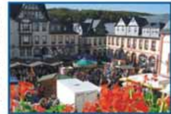
Reges Markttrüben beim Residenzmarkt.

Schon der erste Blick löst keinen Zweifel: Hier haben sich Könige und Grafen zu Hause gefühlt. Tatsächlich zählt die Residenz, die heute den Besucher Weilburgs aus nahezu jeder Perspektive der Stadt in ihren Bann zieht, zu den Baudenkmälern von internationalem Rang. Dabei hat Weilburgs Wahrzeichen seinen ansprechenden Charme nie verloren. Das mag daran liegen, dass es bis heute mit Leben erfüllt ist.