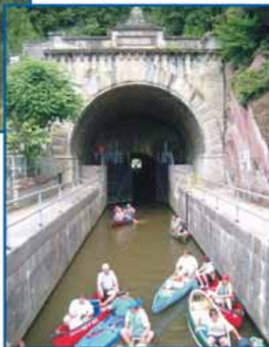
Der einzige Schifftunnel Deutschlands