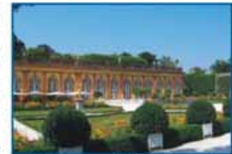
Der Schlossgarten und die Untere Orangerie.

In all den Jahrhunderten prägte die Residenz Leben und Stadtbild. Und so ist es auch heute. Der Schlossgarten – wohl einer der schönsten in Deutschland – ist gemeinsam mit dem Marktplatz ein kultureller und gesellschaftlicher Mittelpunkt einer ganzen Region; die berühmten Schlosskonzerte sind nur ein Beispiel.