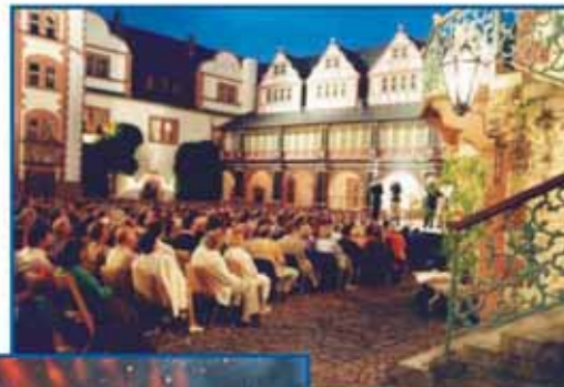
Stimmungsvolle Atmosphäre bei den Weilburger Schlosskonzerten.

Jährlich finden Open-Air-Konzerte statt. Sie runden das Gesamtprogramm ebenso ab wie die regelmäßigen Brunnenkonzerte.