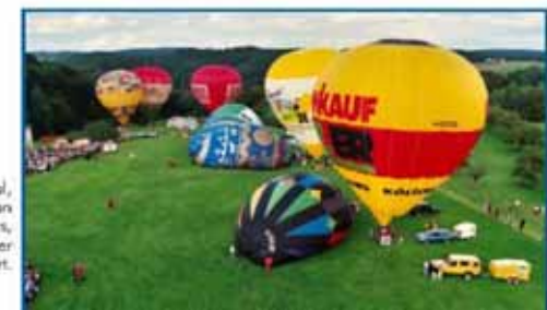
Das Ballonfestival, in Gedenken an Köfchen Paulus, ein Weilburger Pionier der Heißluftballonfahrt.

Informationen zum Schloss erhalten Sie unter Tel.: (0 64 71) 9 12 70 oder www.schloss-weilburg.de